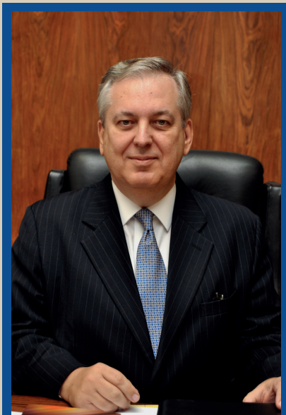
Ambassador LUIZ ALBERTO FIGUEIREDO MACHADO

Born in July 1955, Ambassador Luiz Alberto Figueiredo Machado is a career diplomat, currently serving as Undersecretary for Environment, Energy, Science and Technology at the Ministry of Foreign Affairs of Brazil since 2011.