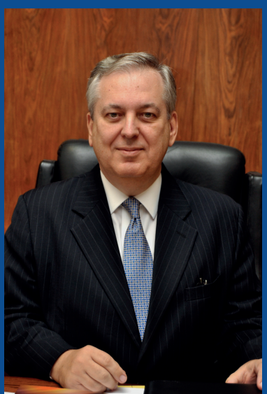
Embaixador LUIZ ALBERTO FIGUEIREDO MACHADO

Nascido em julho de 1955 e bacharel em Direito pela Universidade do Estado do Rio de Janeiro, o Embaixador Luiz Alberto Figueiredo Machado é diplomata de carreira, atualmente ocupando a função de Subsecretário-Geral de Meio Ambiente, Energia, Ciência e Tecnologia do Ministério das Relações Exteriores desde 2011.