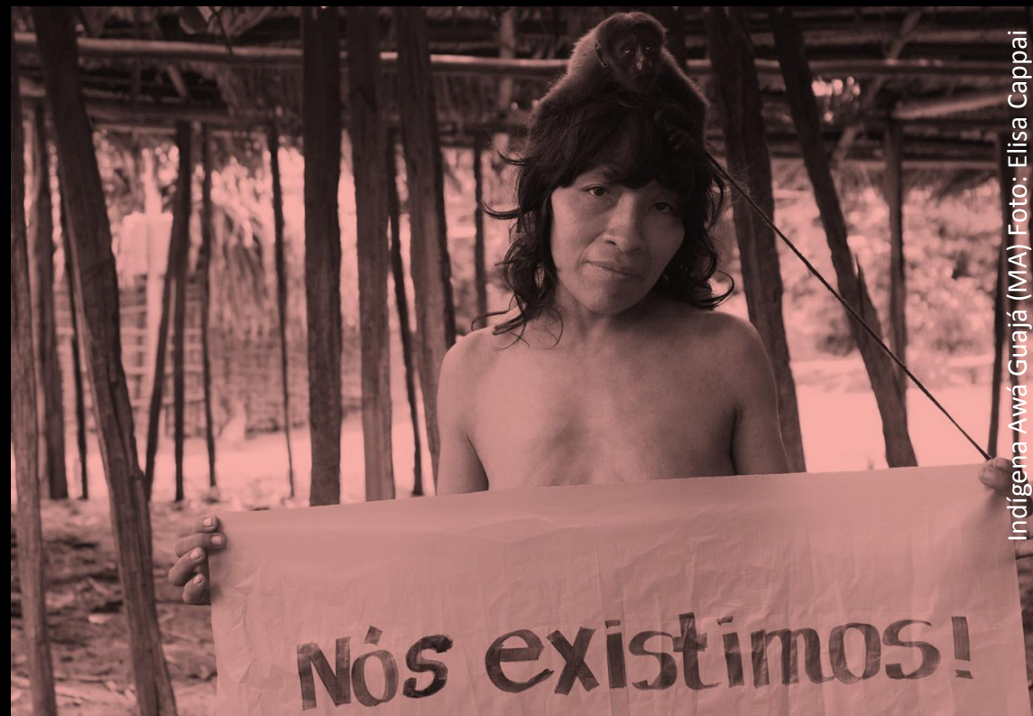
Indígena Awá Guajá (MA)