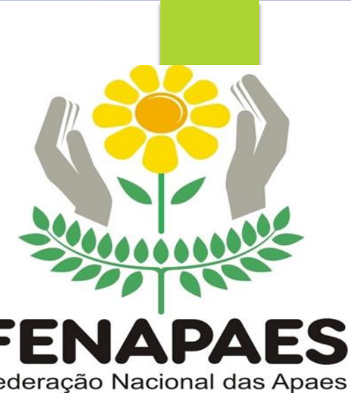
BANDA AFINITAS – ALUNOS DA APAE