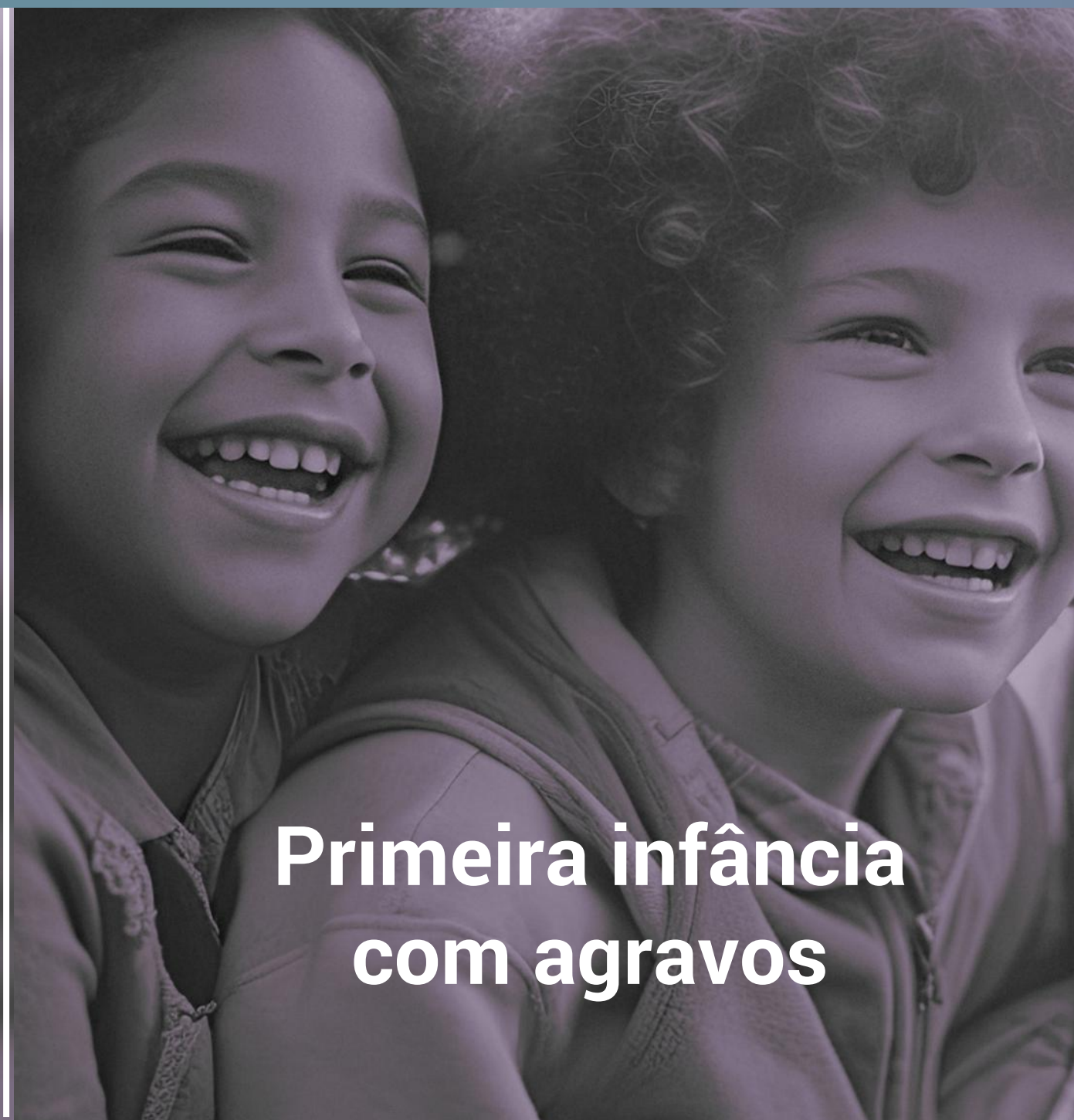
Primeira infância com agravos