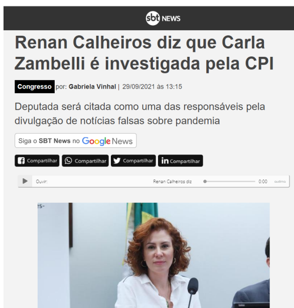
Figura I – extrato de matéria publicada no portal SBT News

17. Ocorre que tal fato foi, ainda, amplamente divulgado na mídia nacional, conforme se pode observar de matéria divulgada no portal SBT News, disponível no endereço https://www.sbtnews.com.br/noticia/congresso/181770-renan-calheiros-diz-que-carla-zambelli-e-investigada-pela-cpi :