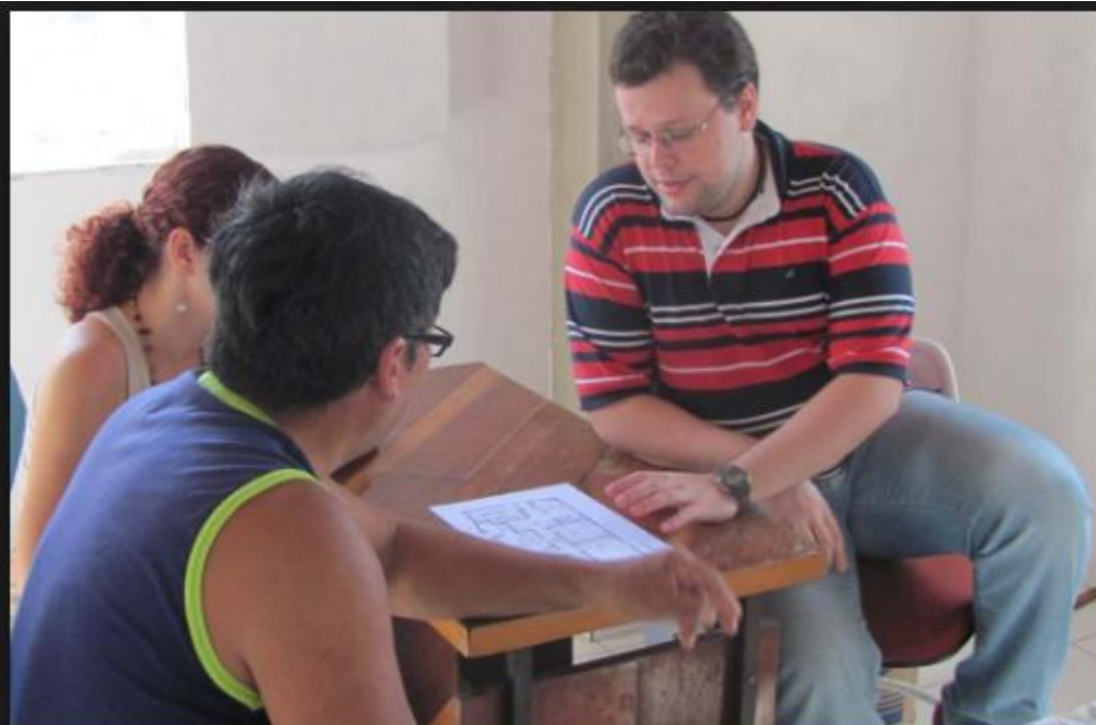
APRESENTAÇÃO DO PROJETO À FAMÍLIA