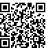
Hugo Roger Martínez Bonilla Ministro das Relações Exteriores Ministério das Relações Exteriores da República de El Salvador

Brasília, D.F., vinte e cinco de outubro de dois mil e dezessete.