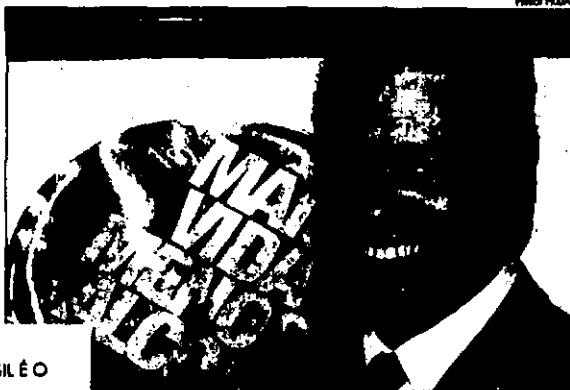
Andrade: País gasta por ano 7,3% do PIB com problemas relacionados ao álcool

De acordo com os pesquisadores, o País gasta 7,3% do Produto Interno Bruto (PIB) por ano para tratar de problemas relacionados ao álcool, que va-