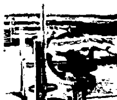
Lacres serão removidos hoje

Cunha Lima ironizou a acusação do INPE de que o dinheiro que foi gasto na região (US$ 11 bilhões em 33 anos) foi pouco. Segundo ele, basta uma conta de dividir para se chegar a conclusão de que US$ 11 bilhões em 33 anos para 10 Estados e aplicados em 900 mil quilômetros quadrados, não se poderia fazer mu-