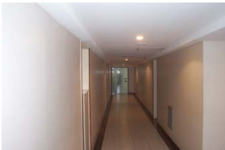
1 - 21/07/2005 - Reforma do Térreo