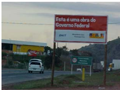
2 - 10/06/2005 - Placa da obra - BR 101 - contorno de Vitória/ES