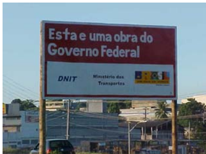
1 - 10/06/2005 - Placa da Obra