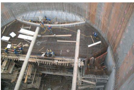
3 - 28/04/2005 - ESTAÇÃO CAMPO DA PÓLVORA - VISTA SUPERIOR