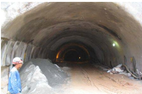
2 - 28/04/2005 - TÚNEL PRINCIPAL - ESTAÇÃO LAPA