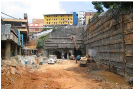
1 - 27/04/2005 - ESTAÇÃO LAPA