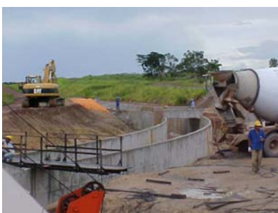
3 - 01/04/2005 - INÍCIO DO CANAL PRINCIPAL ZERO - CP0