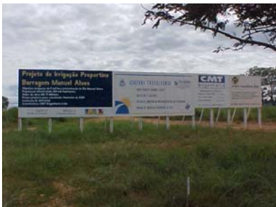
1 - 01/04/2005 - PLACA DA OBRA