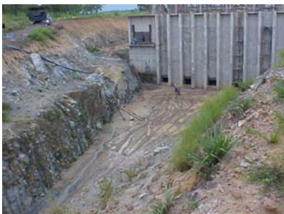
2 - 01/04/2005 - CANAL DE APROXIMAÇÃO E ESTAÇÃO DE BOMBEAMENTO PRINCIPAL