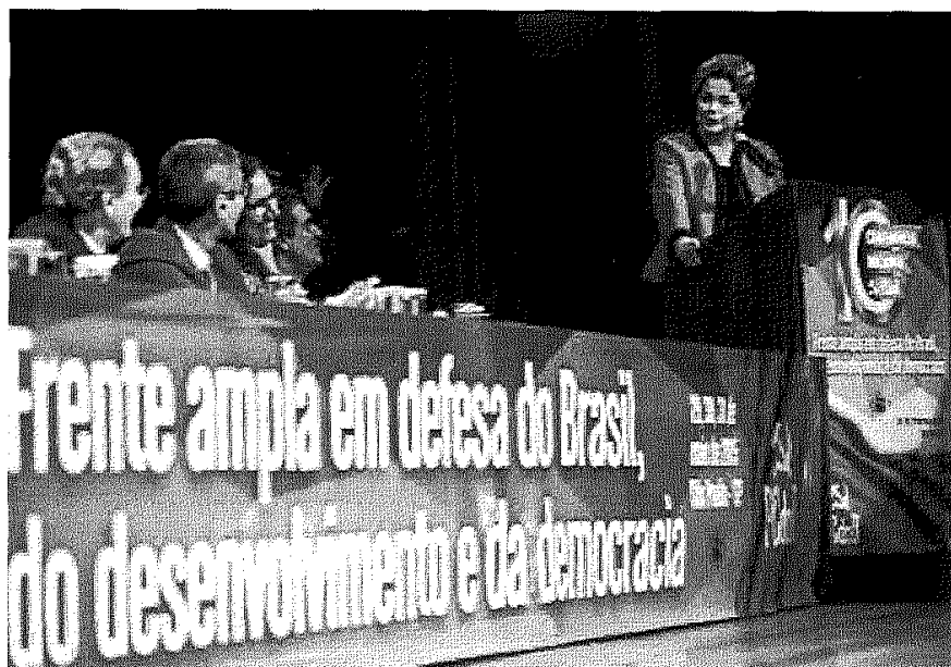
Presidenta Dilma na 10ª Conferência do PCdoB em maio deste ano

Pelo nono mês seguido, o país é duramente castigado por uma crise política que lhe dificulta superar um danoso período de recessão. Embora um elenco amplo de forças políticas, sociais e econômicas já tenha proclamado a