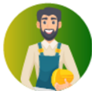
TRABALHADORES NO REGIME GERAL