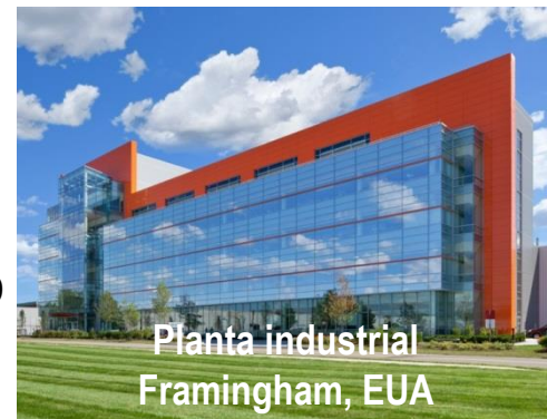
Planta industrial Framingham, EUA