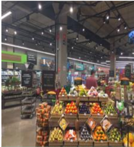
Pão de Açúcar