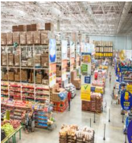
Atacado de Autoserviço