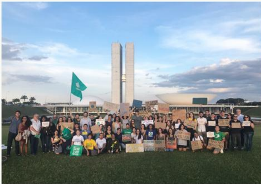
2ª Manifestação | 24 Maio